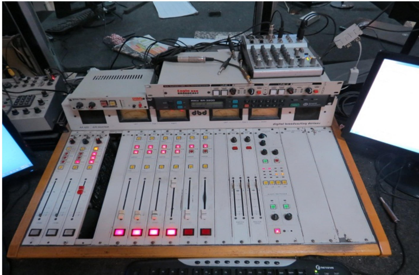
LRA 28 La Rioja