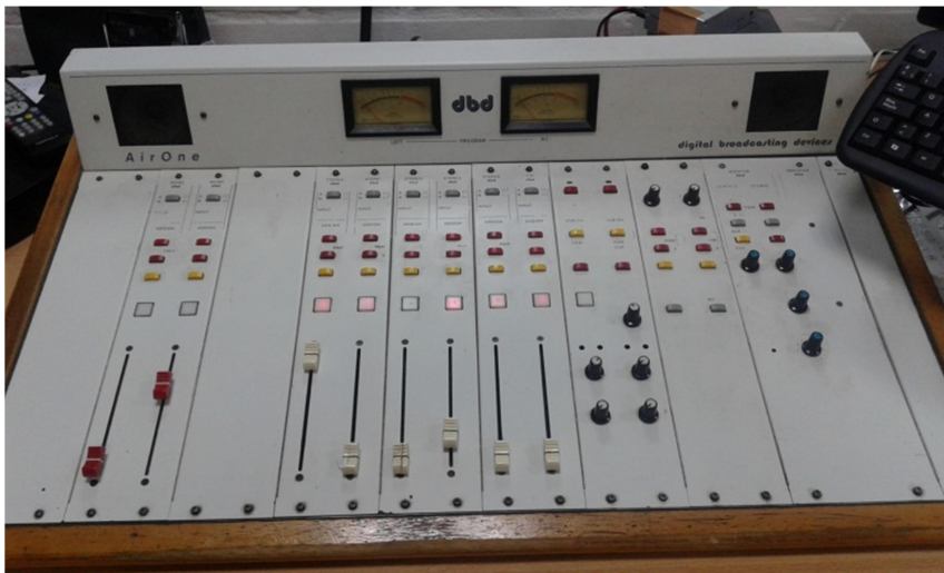
LRA 26 Resistencia