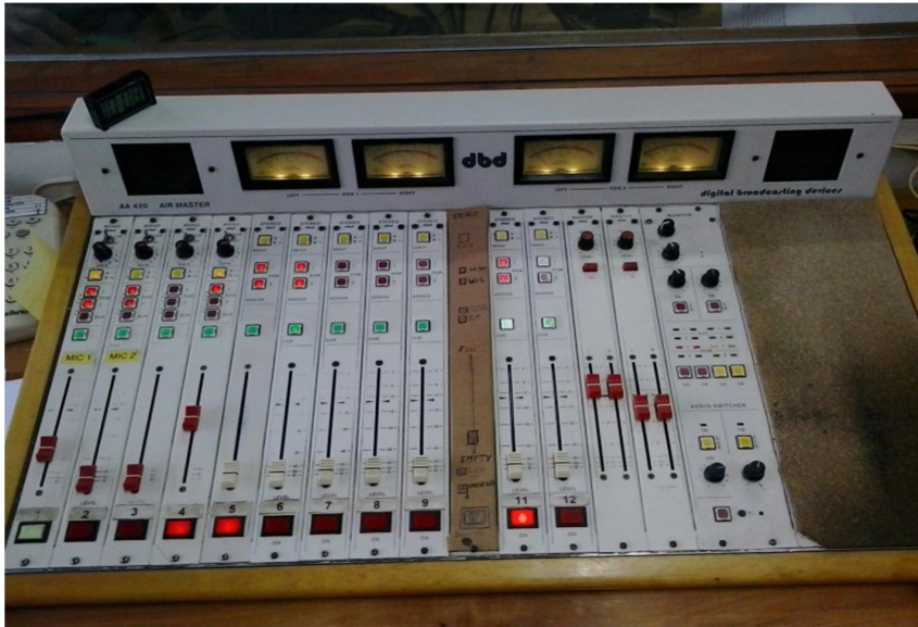
LRA 53 San Martin de los Andes